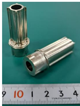
〈コアローター〉 特徴:複雑形状鍛造