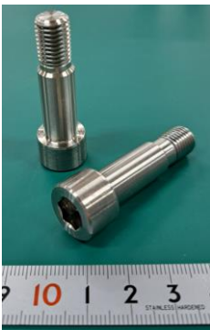
〈ニッケル合金ボルト〉 特徴:耐熱・耐食